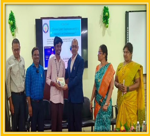
Prize Distribution to the winners