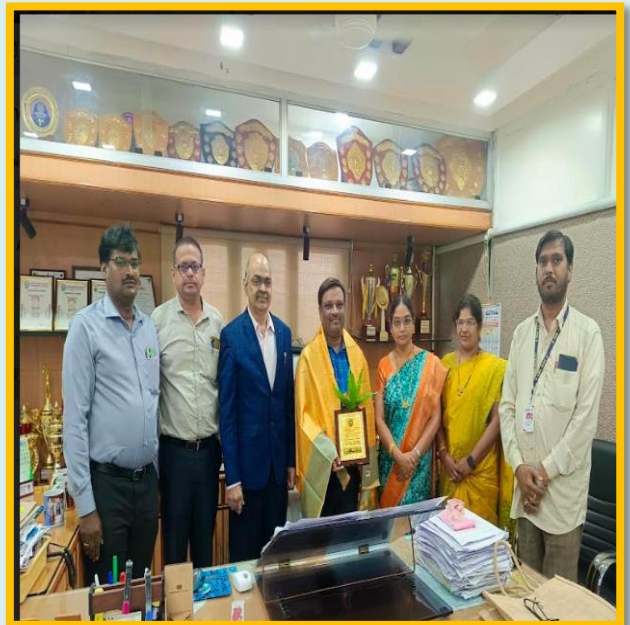
Felicitation to the Resource Person